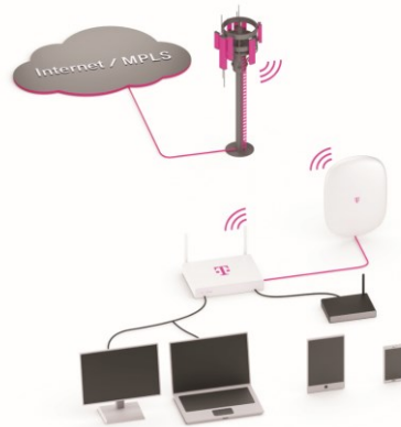
Abbildung 1: Corporate Mobile Start (beispielhafte Abbildung)

Folgende Tarife können mit diesem Produkt genutzt werden: